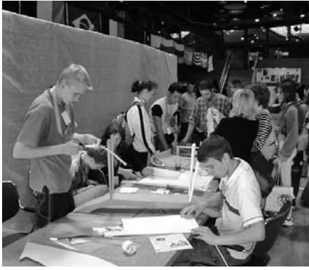
Impressionen von der ESE 2004