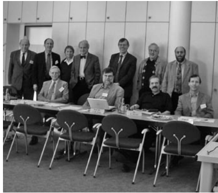
Wissenschaftlicher Beirat des IFW Dresden