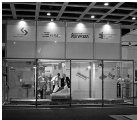
Unser Messestand auf der InnoTrans 2004 in Berlin

Die beteiligten Projektpartner sind die Baumüller Kamenz GmbH, die Cideon Engineering GmbH Bautzen, die Dresdner Verkehrsbetriebe AG, die ELBAS Elektrische Bahnsysteme Ingenieur-Gesellschaft mbH Dresden, das Leibniz-Institut für Festkörper- und Werkstoffforschung Dresden, die Technische Universität Dresden und das Zentrum für Angewandte Forschung und Technologie (ZAFT) an der HTW Dresden. Das Vorhaben wird im Rahmen der Technologieförderung mit Mitteln des Europäischen Fonds für regionale Entwicklung (EFRE) 2000 – 2006 und mit Mitteln des Freistaates Sachsen gefördert. ■