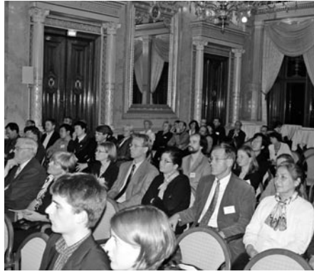
Eröffnung des Bunsenmeetings