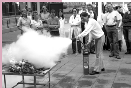
Präventionstage: Übungen am Feuerlöscher