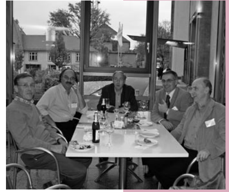
Gespräche am Rande des Bunsenmeetings