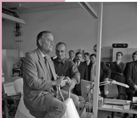
Der Technische Vorstand der Dresdner Verkehrsbetriebe testet den SupraTrans