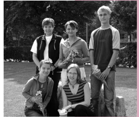
Unsere neuen Auszubildenden