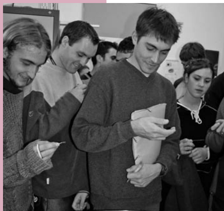
Französische Jugendliche im IFW