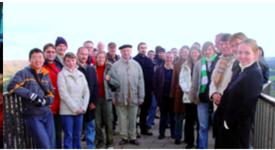
Teilnehmer der Bunsendiskussionstagung in Rathen