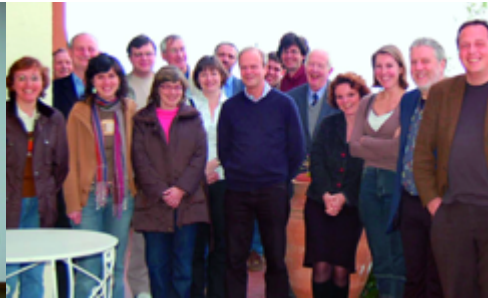
Kick-off-Meeting des neuen EU-Netzwerkes Gladnet