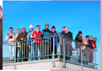
IFW-Winterschule 2007 ohne Schnee