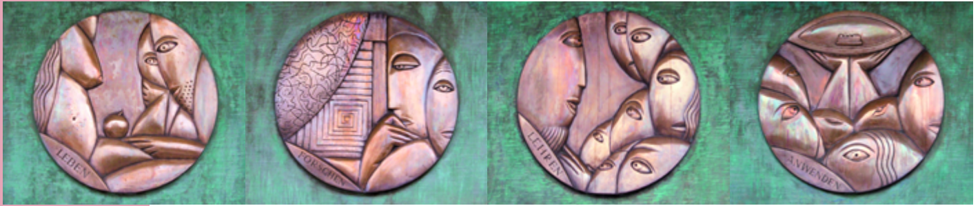
Vier neue Reliefplatten schmücken den Instituseingang, der im Dezember 2006 nach dem notwendig gewordenen Umbau mit einer kleinen Feier eingeweiht wurde: sie stehen für leben, forschen, lehren und anwenden.