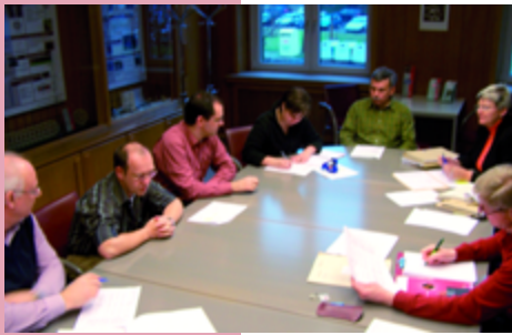
Schutzrechtskommission berät über Patente