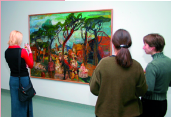
Vernissage zur Ausstellung von Babak Nayebi