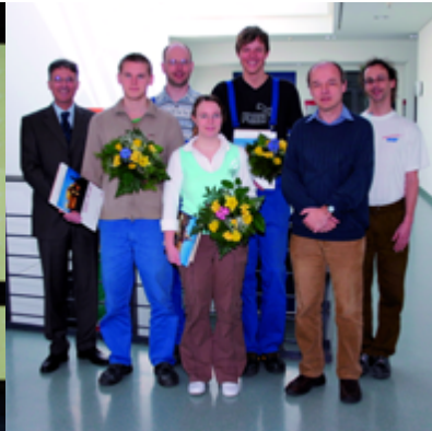
Erfolgreiche Jungfacharbeiter mit Ausbildern