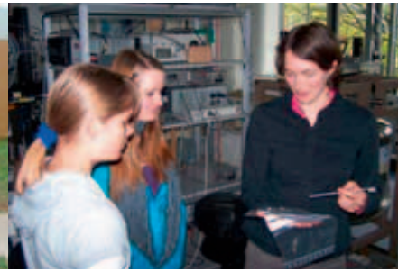
Girlsday 2011, klein aber fein