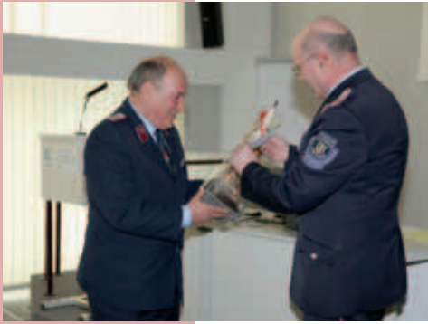
Herr Lindenkreuz wird verabschiedet