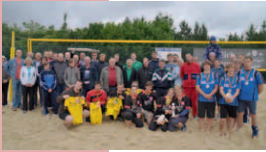
IFW-Team erfolgreich im Firmen-Beachcup