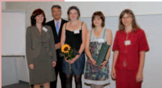
Die Projektleitung mit den Preisträgern für die beste Präsentation.