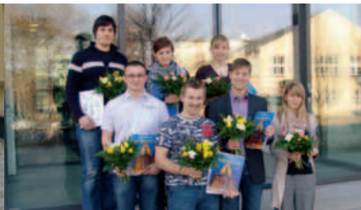
Erfolgreicher Abschluss der Ausbildung