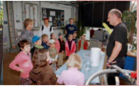
Kinderführung zur Langen Nacht