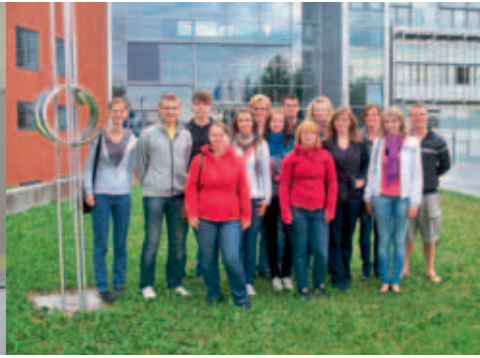
Azubis mit ihren Ausbildern auf Reisen