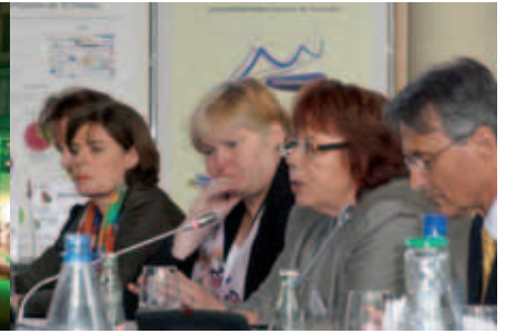
Abschlussstagung des FINA-Projektes