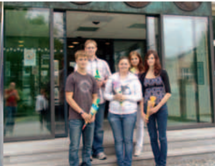
Unsere neuen Azubis