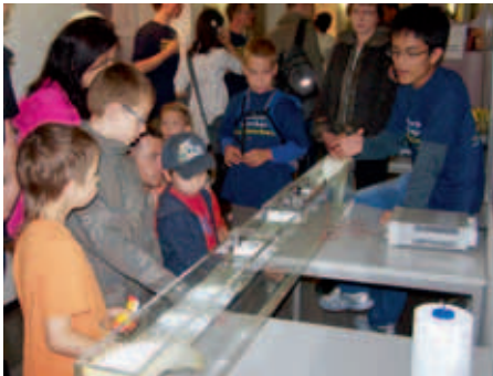
Großer Ansturm im IFW zur Langen Nacht