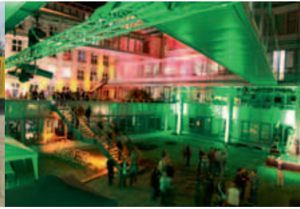
Innenhof am Ende der Langen Nacht