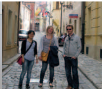
unterwegs in Smolenice