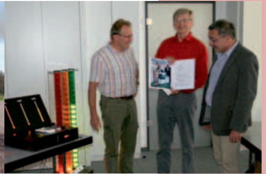
Übergabe des GMR-Demonstrators an die Hochschule Lausitz