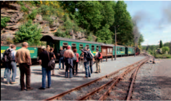
Jahresseminar des Kaufmännischen Bereichs