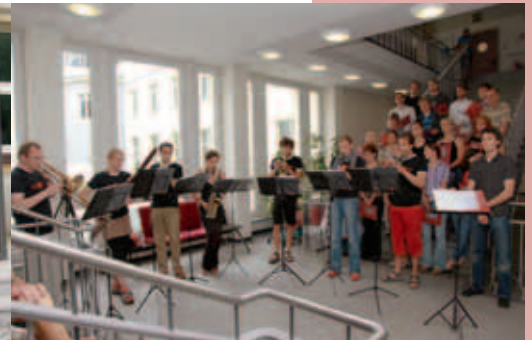
Sommerkonzert von Chor und nanonics